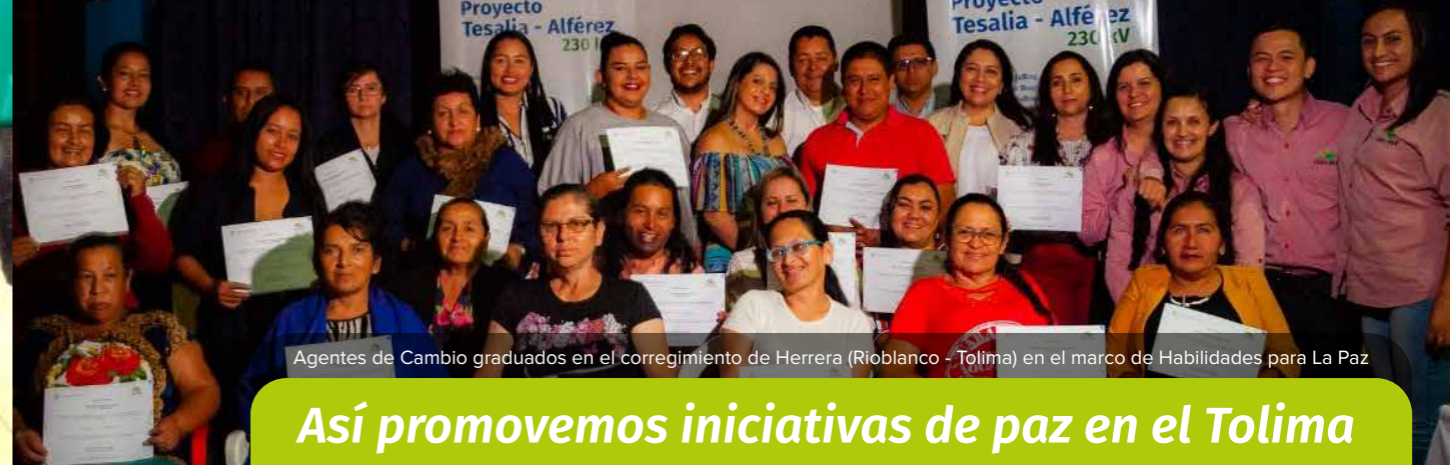
Agentes de Cambio graduados en el corregimiento de Herrera (Rioblanco - Tolima) en el marco de Habilidades para La Paz

Son plantas que viven sobre los árboles, sin embargo, no les causan daño. Éstas promueven la biodiversidad en los bosques y son importantes ya que generan oxígeno, sirven de hábitat a otros seres vivos, se convierten en “Oasis” en tiempos de sequía, tienen múltiples interacciones con animales y cuando ellas mueren, son las que enriquecen los suelos con nutrientes para nuevas plantas del bosque