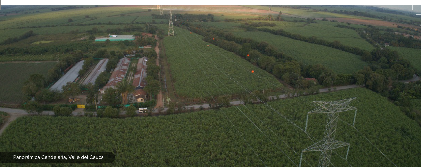
Panorámica Candelaria, Valle del Cauca